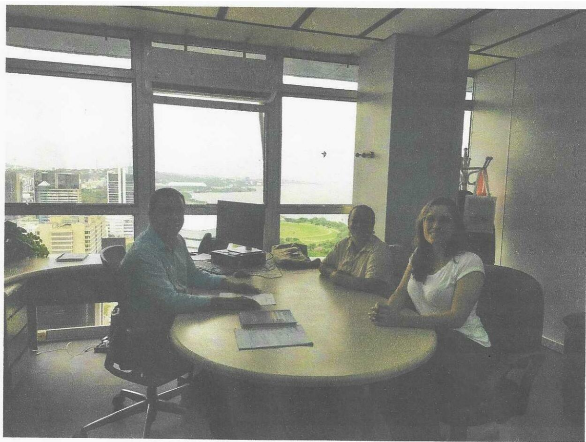
GABINETE DO VICE GOVERNADOR